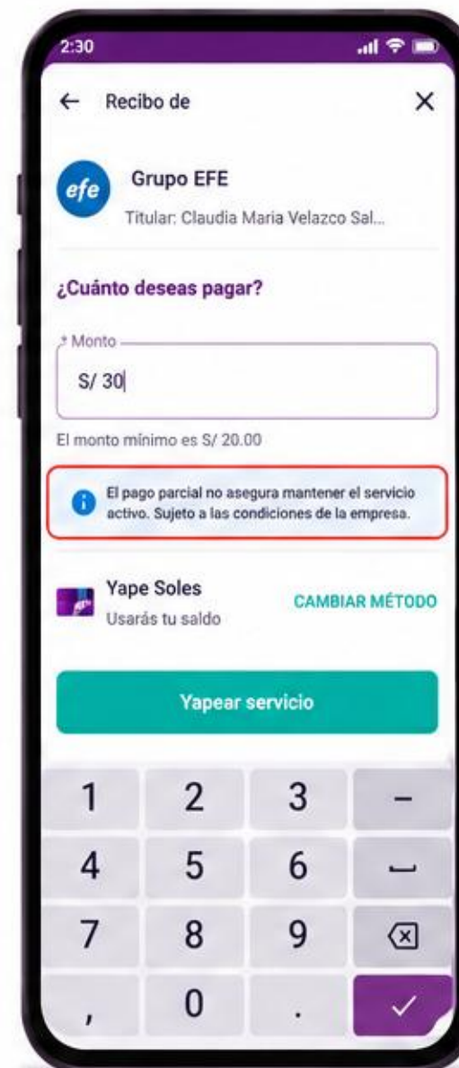
Mensaje personalizado por servicio a través de la BO