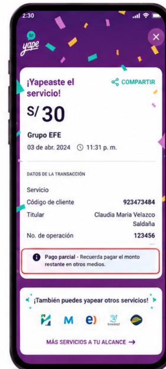
Mensaje genérico para todos los pagos parciales